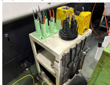
加工工場内の手作りの工具置場

金 属 加工を加工する加工グループでは、グチャグチャになりがちなのを、定位置化することに力を入れています。