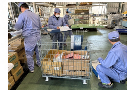
以前に整理した倉庫をあらためて整理

企業・団体の研修や講演を承ります。目的や対象者に応じて、時間や内容をカスタマイズできます。まずはホームページをご覧ください。