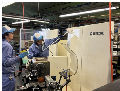
茶色く汚れていた衝立が真っ白になった